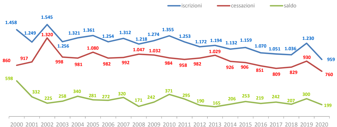
Nati-mortalità imprenditoriale - serie storica trimestrale

Vedi tutte le elaborazioni sulla nati-mortalità delle imprese bolognesi al 30 settembre 2020